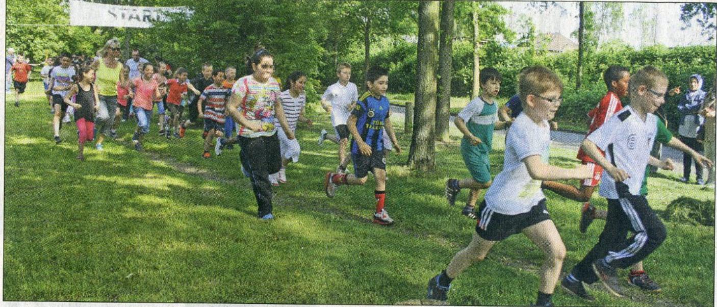
Klasse für Klasse ging es auf die Piste: Voller Einsatz stürmten die Schüler in einer ganzen Reihe von Läufergruppen auf den vier Kilometer langen Parcours.